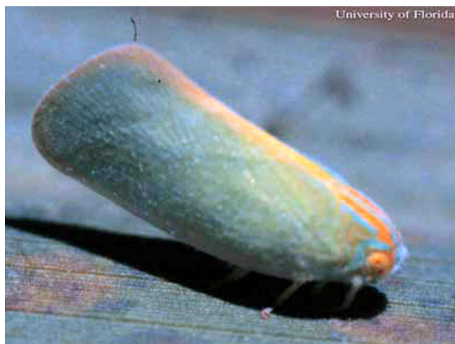
Figure 1. El adulto de Ormenaria rufifascia (Walker), un salta-planta flátido en palmas.

longitudinales en el protórax y mesotórax. Las alas delanteras están bordeadas de color amarillo anaranjado. Sus ojos compuestos son de color anaranjado (Mead 1965).