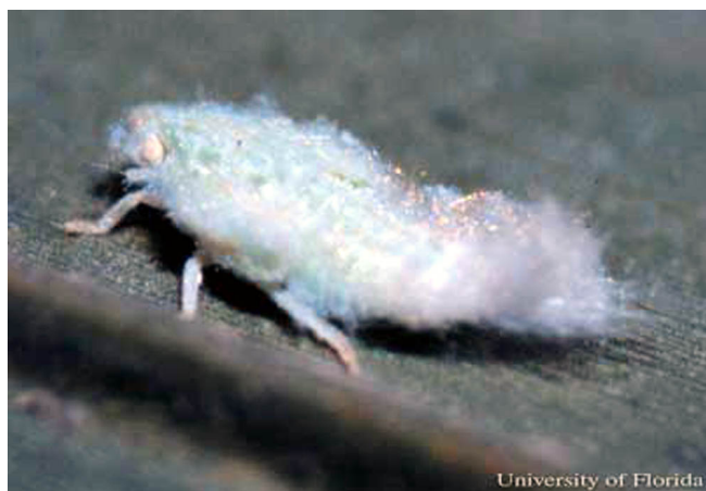
Figure 2. La ninfa de Ormenaria rufifascia (Walker), un salta-planta flátido en palmas.

Ninfas: Las ninfas son de color verde claro con líneas longitudinales amarillas borrosas. Estos colores son parcialmente enmascarados por una capa de cera flocculenta la cual ellas secretan. Filamentos caudales de cera se arrastran detrás de ellas cuando se mueven en la superficie de la hoja.