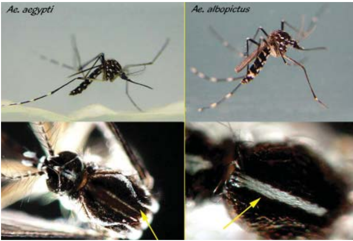
Figure 1. Aedes aegypti (izquierda) y Aedes albopictus (derecha)

Los adultos se encuentran en o cerca de ambientes humanos, frecuentemente picando bajo techo o en sitios resguardados cerca de casas. Este mosquito pica principalmente de día, pero infrecuentemente puede picar temprano en la noche. Recipientes de agua, tanto naturales como artificiales funcionan como hábitculos larvales para esta especie. Ejemplos incluyen latas desechadas, llantas de automóvil, escurrideros de techo, barriles de agua, macetas, fitotelmata (ambientes acuáticos situados en plantas tal como los que ocurren en las axilas de bromelias y en huecos en los troncos de árboles), desperdicios que matienen agua, y muchos otros.